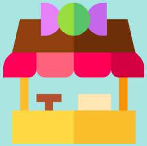
TIENDA DE DULCES