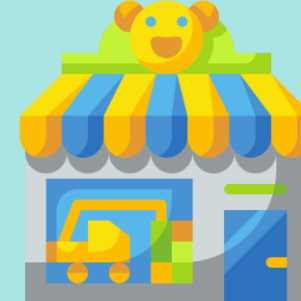
TIENDA DE JUGUETES